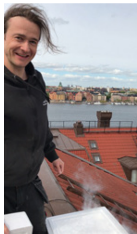
20 kg kolsyreis användes vid testet.