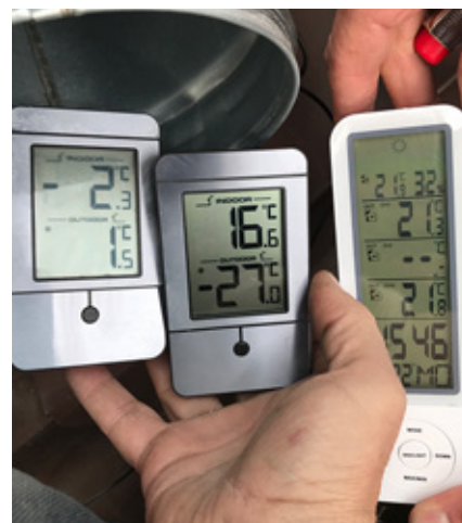
Vid -27 grader på uteluften via kolsyreis gav systemet drygt +21 grader tilluft i lägenheter.