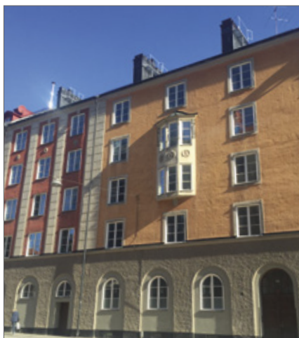
Clean-Air24 FTX har med mycket lyckat resultat installerats i självdragsfastigheter sedan 2013.